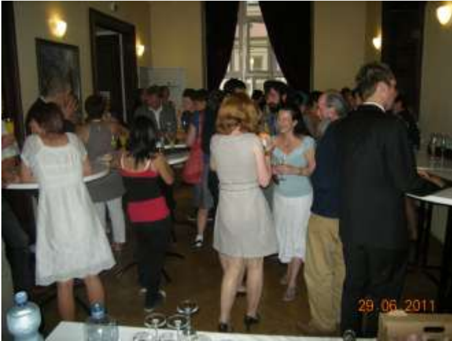
Maturazeugnisverleihung am 29.06.2011