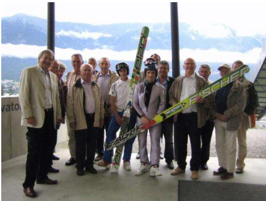
Auf dem Sprungturm der Berg Isel Schanze mit Springern aus Rumänien.